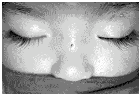
Figura 1. Paciente de 3 años 7 meses con quiste dermoide nasoetmoidal. Preoperatorio, observándose orificio fistuloso con pelos

Los 3 pacientes fueron de sexo femenino, con una edad promedio de 3,5 años ( figuras 1 y 2 ). En todos ellos, el diagnóstico se realizó durante el primer año de vida por infección local y la observación de una fístula medio nasal con presencia de pelos. El estudio para precisar la extensión de la lesión, se realizó con tomografía axial computada (TAC) de alta resolución en todos los pacientes y además con resonancia nuclear magnética (RNM) en uno de ellos, debido a la sospecha de una fístula al sistema nervioso central, que finalmente sólo fue descartada por la exploración intraoperatoria y la favorable evolución posterior. En los 3 pacientes se descartaron malformaciones asociadas. Uno de ellos requirió drenaje de un absceso medio nasal previo a la extirpación del quiste. En los 3 casos se administró antibióticos desde el período preoperatorio.